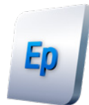
Sophos Endpoint Intercept X